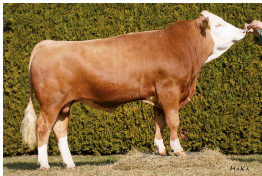
Züchter: Bernhart Josef, Oberneukirchen