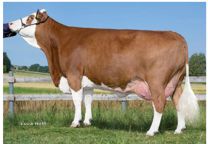
Gerbera, Großmutter von Hybrid Schürer-Hammon GbR, Oettingen